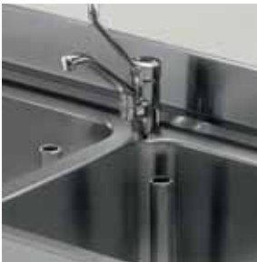
Detail Einlocharmatur mit Hebel