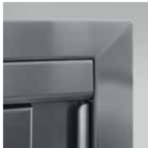
Detail obere gelötete Ecken