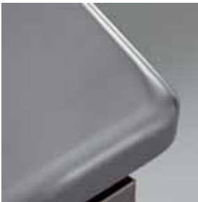
Detail strahlenförmige Fläche