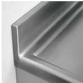
Detail Aufkantung, nach hinten geschlossen