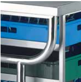
Detail überstehendes Gestell