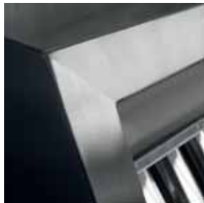
Detail gelötete Ecken