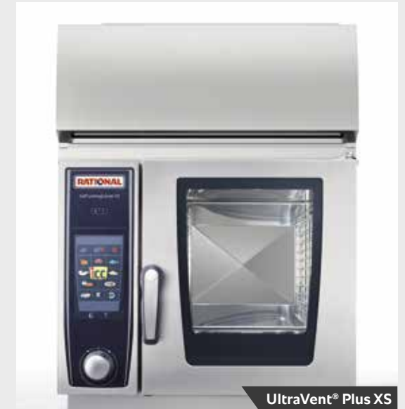
UltraVent® Plus XS

Mit dem neuen Kreuz- und Streifen-Grillrost erhalten Sie ein perfektes Grillmuster auf Kurzgebratenem, Fisch und Gemüse. Hierbei haben Sie die Wahl: Neben den klassischen Grillstreifen lässt sich mit dem neuen Grillrost, auch das beliebte original amerikanische Steakhouse-Muster auf unterschiedlichste Produkte bringen. Der Kreuz- und Streifen Grillrost ist extrem robust und langlebig. Die 3-lagige TriLax® Beschichtung ist bräunungsunterstützend sowie hitze- und laugenbeständig.