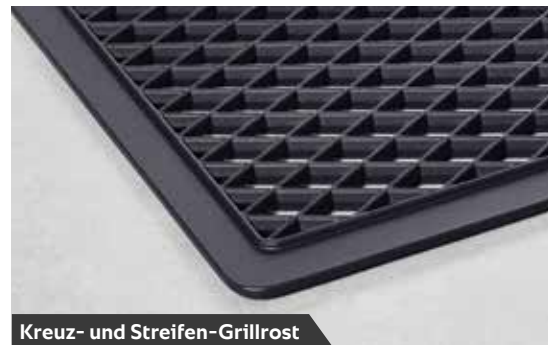
Kreuz- und Streifen-Grillrost

Erst die Verwendung des Original RATIONAL-Zubehörs erschließt Ihnen die vollen Möglichkeiten des SelfCookingCenter® XS. Es ist von höchster Robustheit und damit bestens für den täglichen, harten Einsatz in der Profiküche geeignet. So gelingen selbst spezielle Anwendungen, wie das Zubereiten vorfrittierter Produkte oder das Grillen von Hähnchen und Enten. Selbst Schnitzel und Steaks bereiten Sie ohne umständliches Wenden zu.