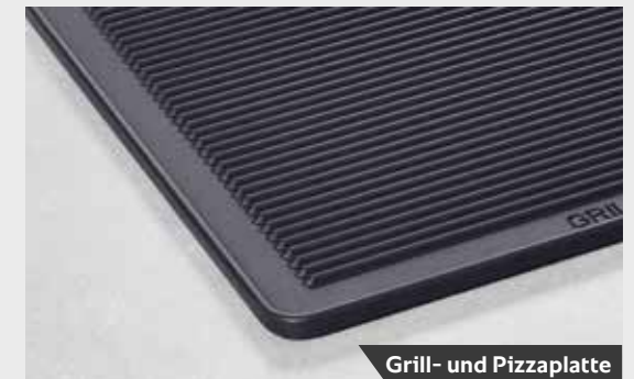
Grill- und Pizzaplatte